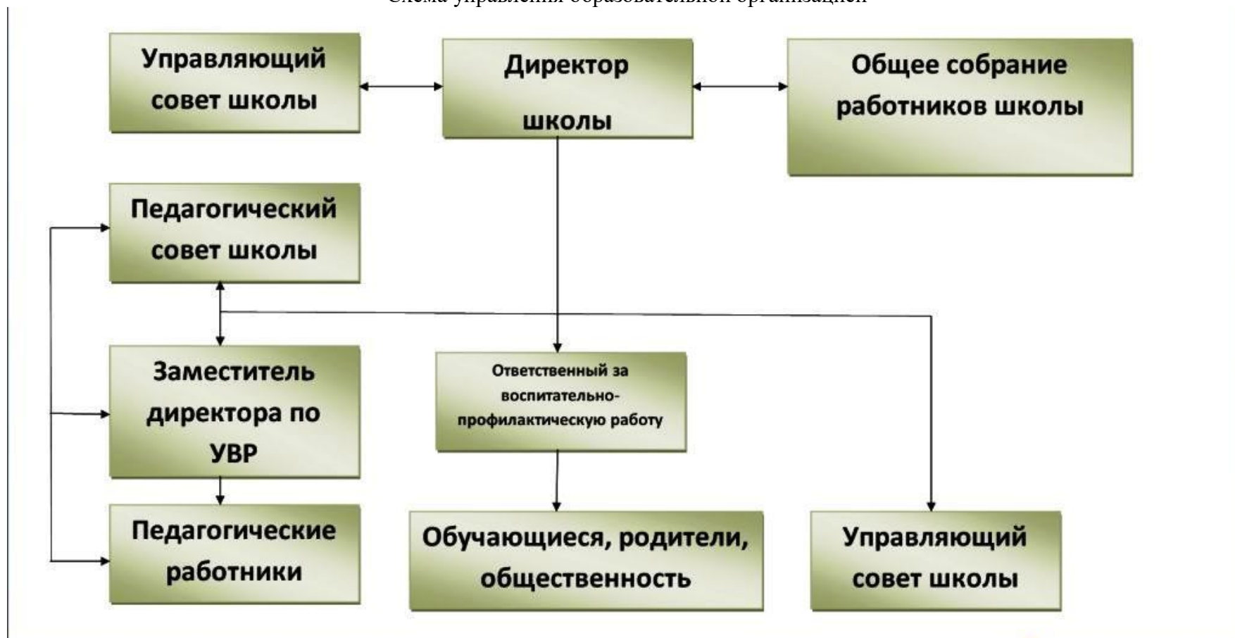
Схема управления образовательной организацией